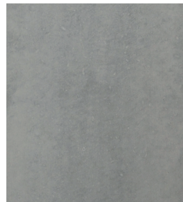
Recette 220 SB Couleur 5% claire