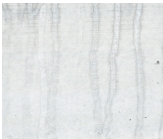
Exposition de courte durée aux conditions météorologiques