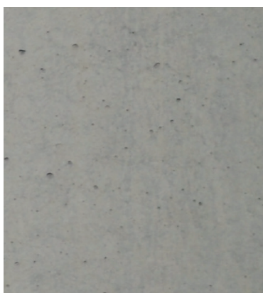
Recette 452 SCC Couleur Nature