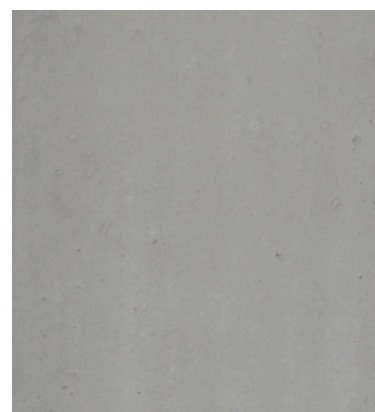
Recette 462 SCC Couleur 5% claire