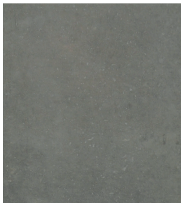
Recette 219 SB Couleur Nature