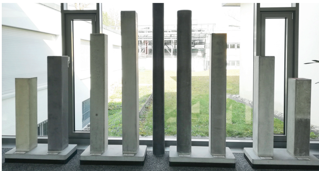
SIA-118/262:2018 Tableau 6 Exigences concernant la peau de coffrage *2

SACAC SA adhère aux recommandations de la Norme SIA118/262. Des échantillons d'éléments les plus courants, permettant de comparer les différentes exécutions (mode de fabrication, chanfreins, finition, teinte etc.), sont exposés dans notre Showroom. Sur demande, nous fournissons également des échantillons spécifiques à l'objet. Si intéressé, nous vous invitons volontiers pour une visite guidée de notre production. Un aperçu des divers couleurs de surfaces vous sont proposées à la page 5 du présent document.