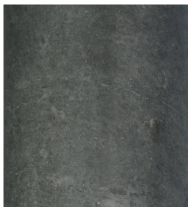
Recette 230 SB Couleur 5% foncée