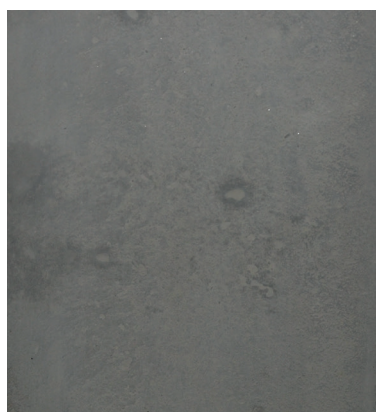
Recette 472 SCC Couleur 5% foncée