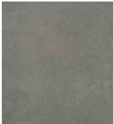
Recette 219 SB Couleur Nature