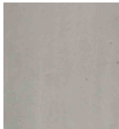
Recette 462 SCC Couleur 5% claire