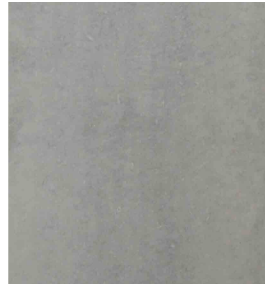
Recette 220 SB Couleur 5% claire