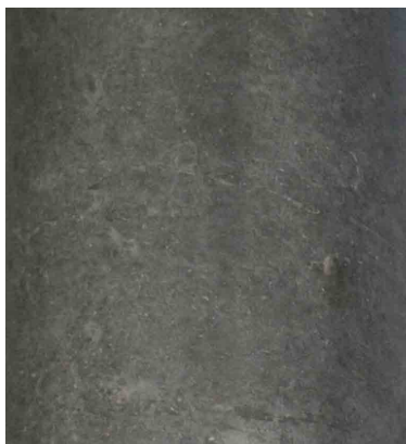
Recette 230 SB Couleur 5% foncée