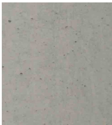
Recette 452 SCC Couleur Nature