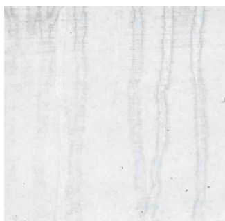
exposition de courte durée aux conditions météorologiques