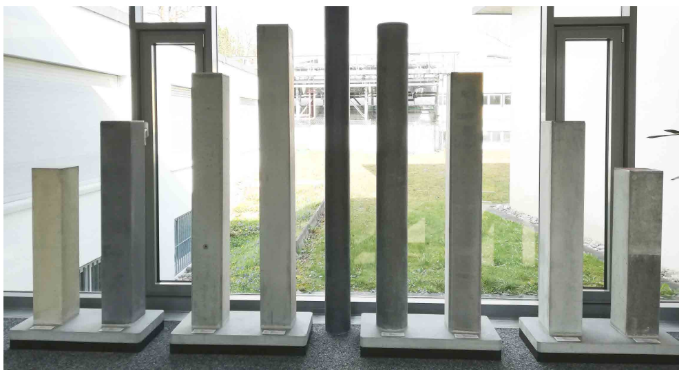
SIA-118/262:2018 Tableau 6 Exigences concernant la peau de coffrage *2

SACAC SA adhère aux recommandations de la Norme SIA118/262. Des échantillons d'éléments les plus courants, permettant de comparer les différentes exécutions (mode de fabrication, chanfreins, finition, teinte etc.), sont exposés dans notre Showroom. Sur demande, nous fournissons également des échantillons spécifiques à l'objet. Si intéressé, nous vous invitons volontiers pour une visite guidée de notre production. Un aperçu des divers couleurs de surfaces vous sont proposées à la page 5 du présent document.