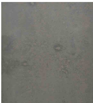
Recette 472 SCC Couleur 5% foncée